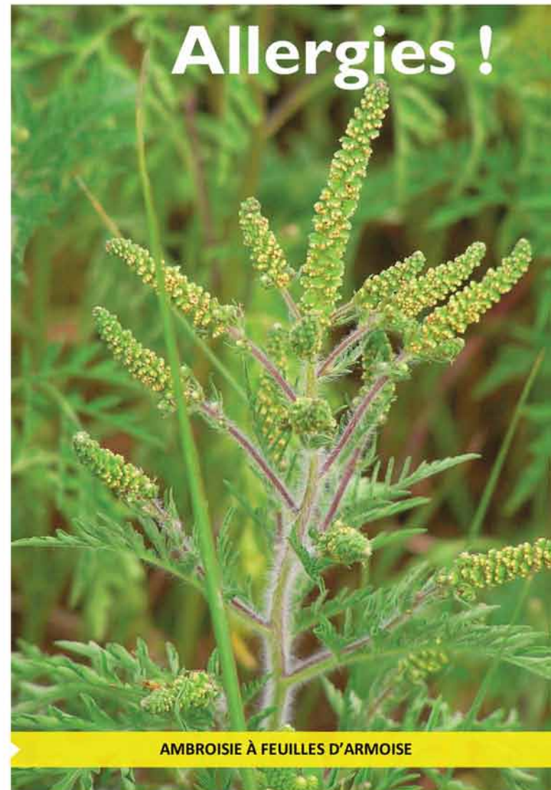
AMBROISIE À FEUILLES D'ARMOISE